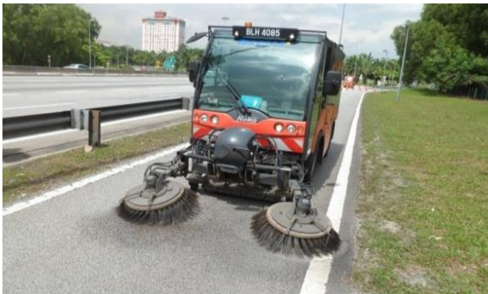
Perkara:Penyenggaraan laluan motosikal menggunakan 'road sweeper'