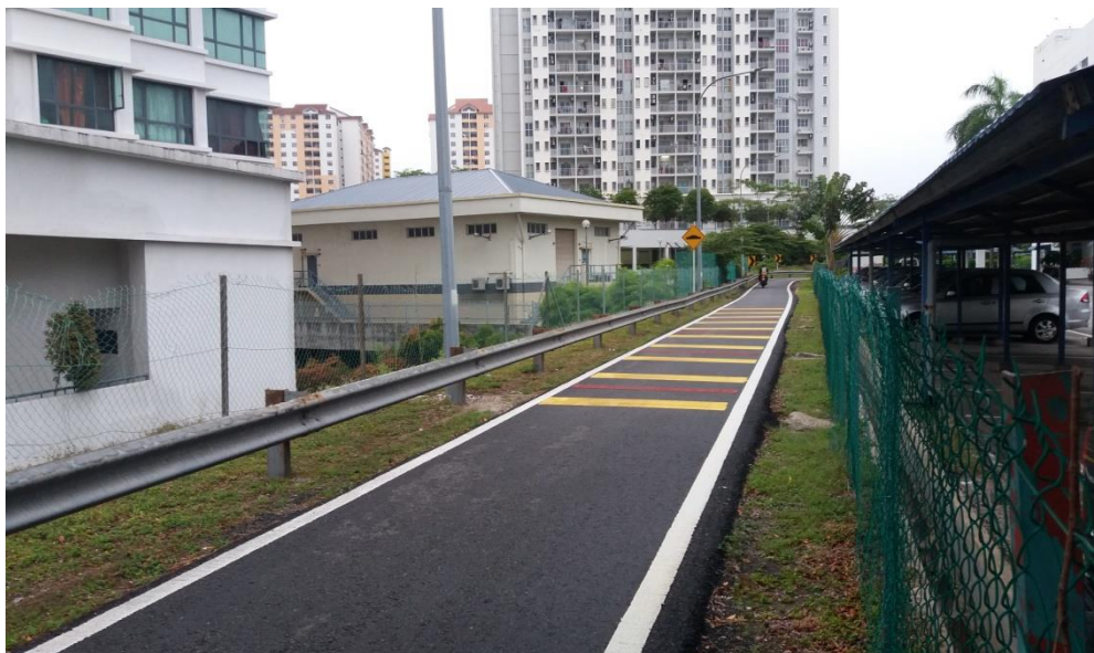
Perkara: Laluan motosikal dibawah penyenggaraan pihak KESAS.