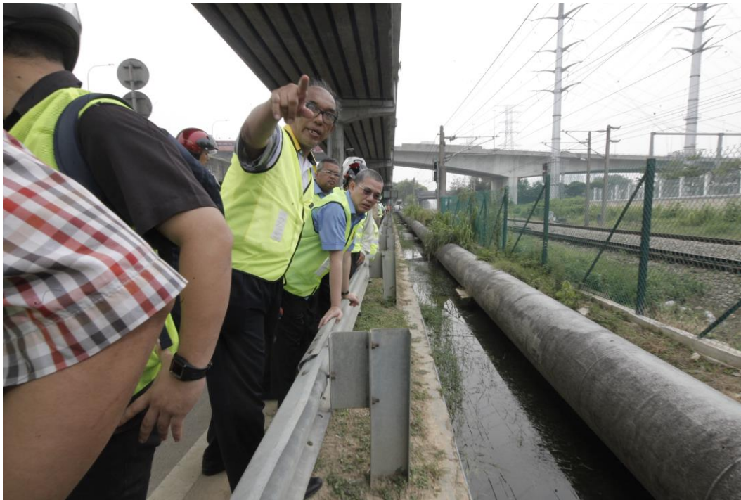
Saluran air tersumbat