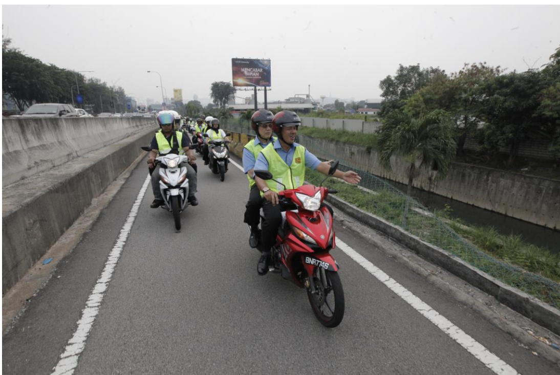
Pagar keselamatan yang telah rosak

Berikut adalah foto lawatan kerja YB Menteri Kerja Raya ke Lorong Motorsikal Jalan Persekutuan pada 29 Ogos 2016: