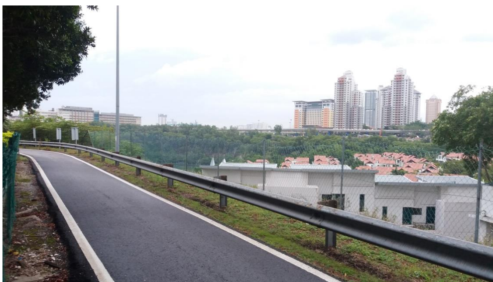
Perkara: Laluan motosikal dibawah penyenggaraan pihak KESAS.