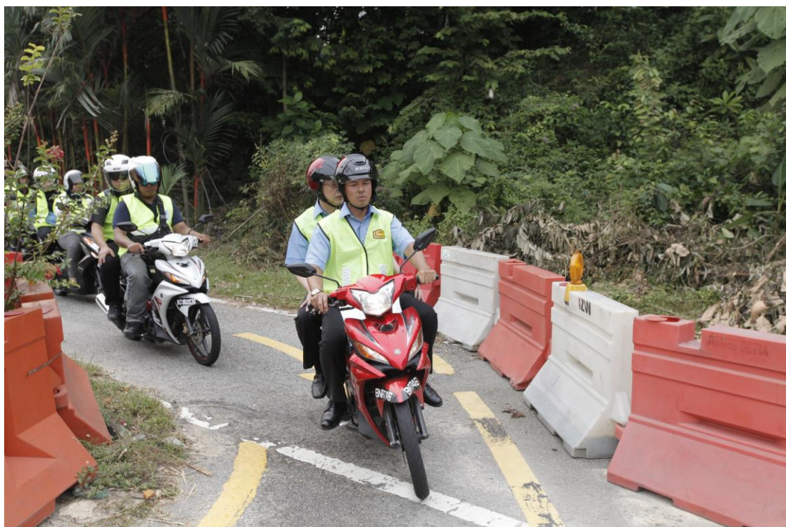
lencongan sementara di lokasi pembinaan