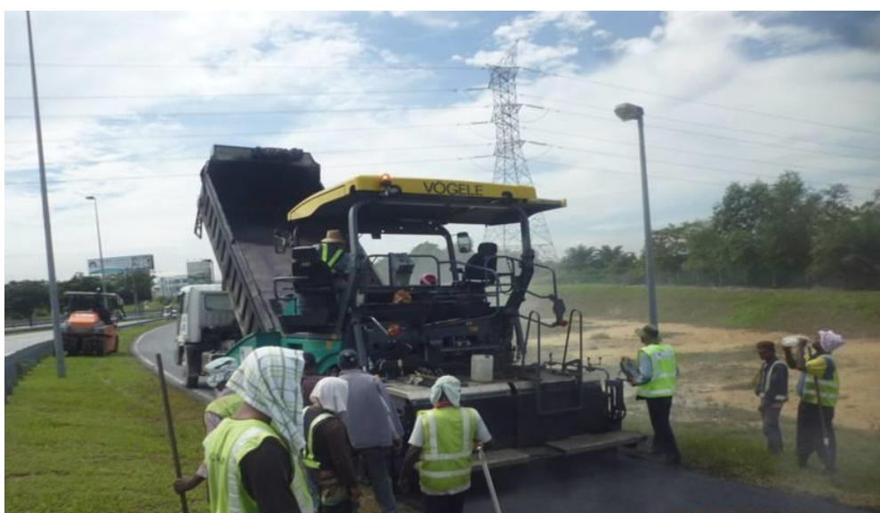
Perkara:Kerja-kerja 'Pavement Rehabilitation' yang telah dilaksanakan.