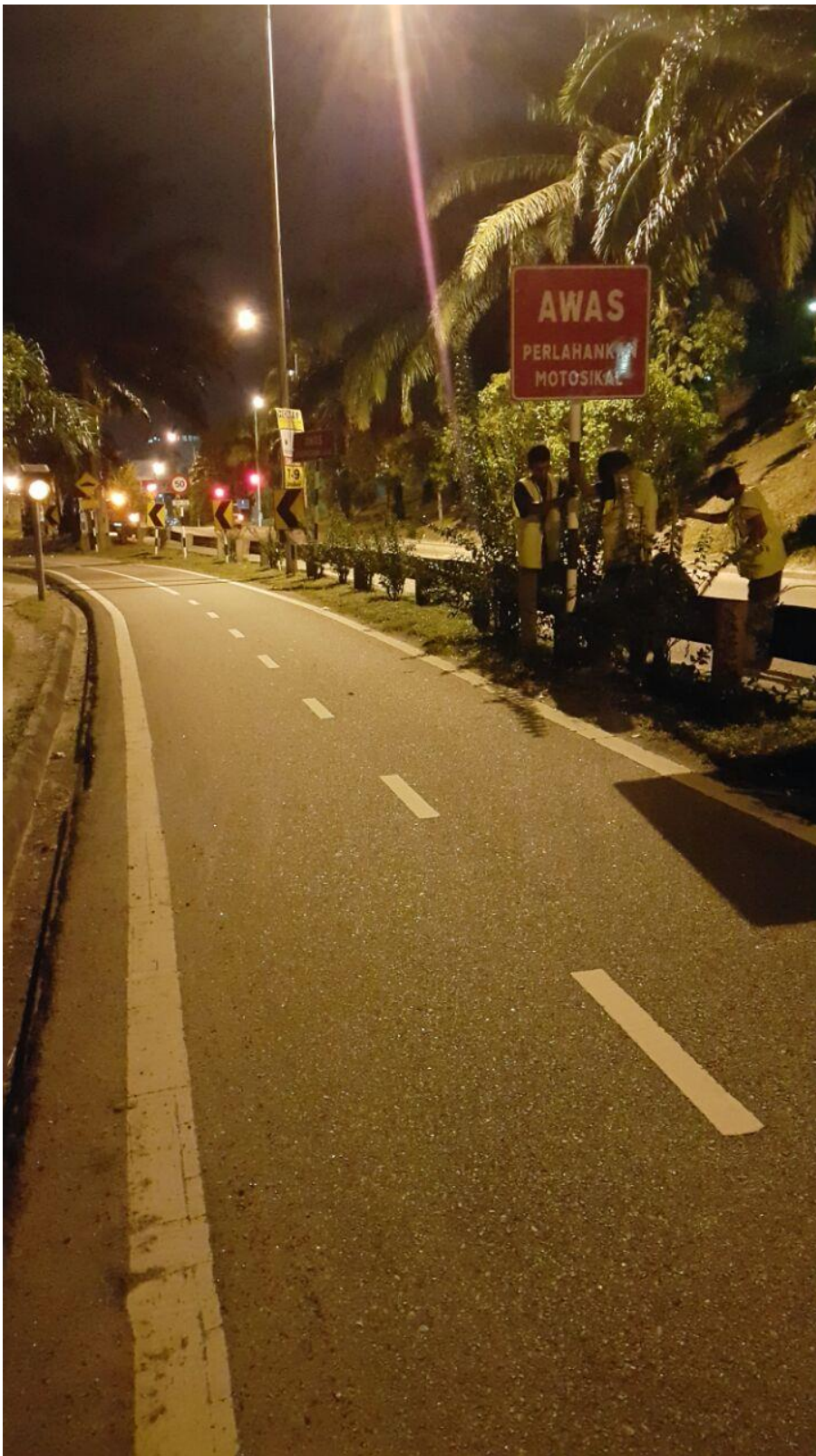
Pemasangan papan tanda amaran di lorong motosikal.