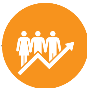
'Kebersamaan' Common Ground