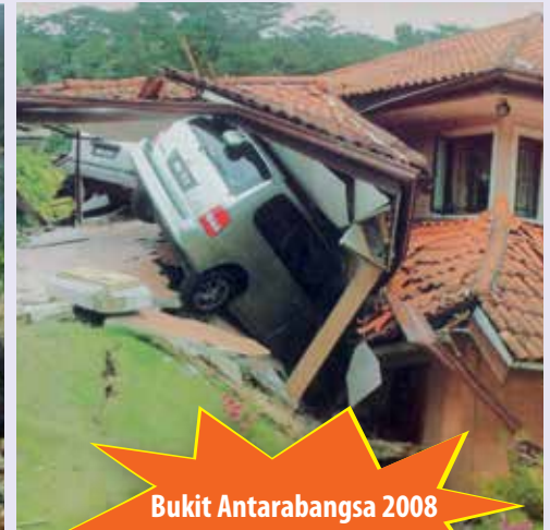
Bukit Antarabangsa 2008 14 rumah musnah

Bencana tanah runtuh tetap berlaku walaupun pengawasan yang teliti telah dilaksanakan. Tips ini memberi persediaan kepada anda untuk bertindak pantas sekiranya tanah runtuh terjadi. Tindakan anda boleh membezakan antara keselamatan nyawa atau tragedi.