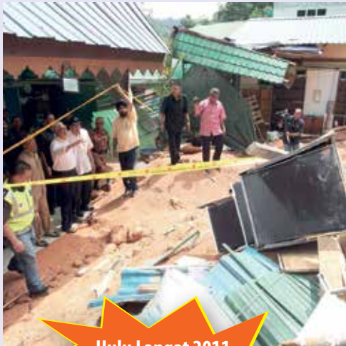
Hulu Langat 2011 16 nyawa terkorban

Cawangan Kejuruteraan Cerun JKR Malaysia