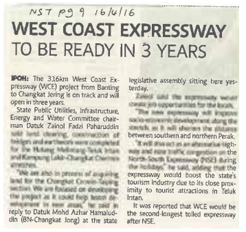
Surat Khabar : NEW STRAITS TIMES Tarikh : 16 April 2016