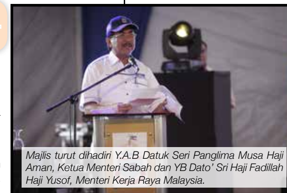
Majlis turut dihadiri Y.A.B Datuk Seri Panglima Musa Haji Aman, Ketua Menteri Sabah dan YB Dato' Sri Haji Fadillah Haji Yusof, Menteri Kerja Raya Malaysia.