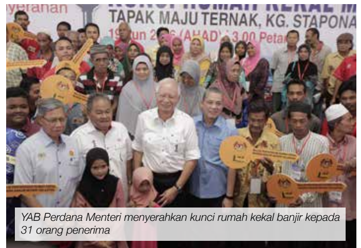
YAB Perdana Menteri menyerahkan kunci rumah kekal banjir kepada 31 orang penerima

Projek itu melibatkan pembinaan 11 buah wad dengan 268 katil, lapan buah dewan bedah, lapan bilik bersalin serta pusat rawatan harian. Dibina berkonsepkan hospital dalam taman dan ia bakal dilengkapi dengan peralatan perubatan, perkhidmatan sokongan klinikal yang terkini, selain bangunan pentadbiran, tempat letak kereta dan kemudahan untuk kakitangan, orang kelainan upaya serta pelawat.