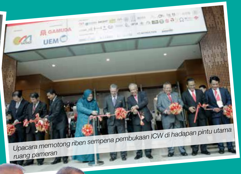
Upacara memotong riben sempena pembukaan ICW di hadapan pintu utama ruang pameran