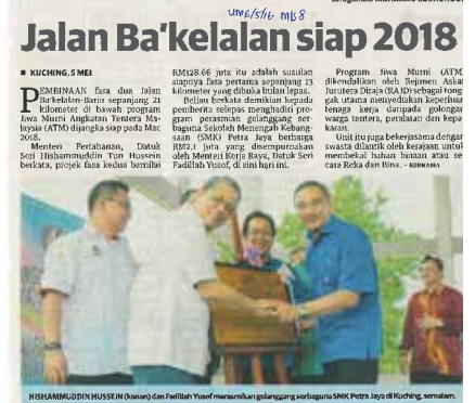
Surat Khabar : UTUSAN MALAYSIA Tarikh : 06 MEI 2016