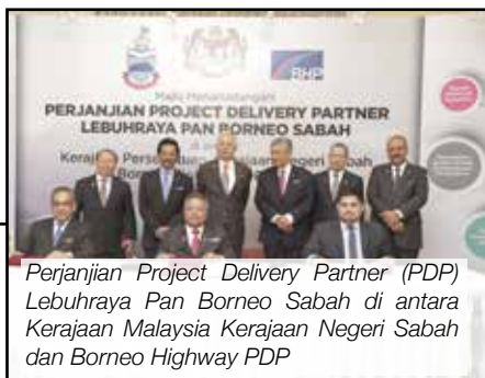
Perjanjian Project Delivery Partner (PDP) Lebuhraya Pan Borneo Sabah di antara Kerajaan Malaysia Kerajaan Negeri Sabah dan Borneo Highway PDP