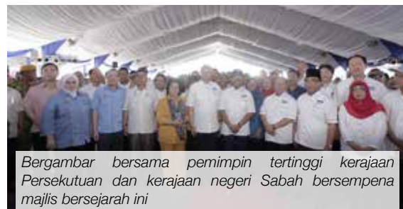
Bergambar bersama pemimpin tertinggi kerajaan Persekutuan dan kerajaan negeri Sabah bersempena majlis bersejarah ini