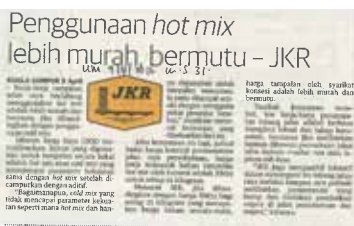
Surat Khabar : UTUSAN MALAYSIA Tarikh : 09 April 2016