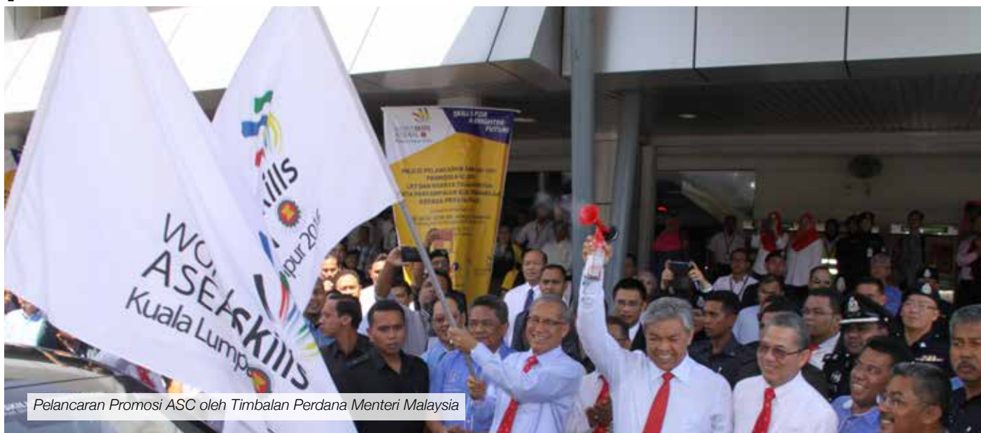
Pelancaran Promosi ASC oleh Timbalan Perdana Menteri Malaysia

Mesyuarat Jemaah Menteri bertarikh 17 September 2014 telah meluluskan Malaysia untuk menganjurkan Asean Skills Competition (ASC) ke-11 (ASC 2016), pertandingan kemahiran peringkat ASEAN yang dianjurkan setiap dua tahun bermula pada 1995 di mana Malaysia merupakan tuan rumah ketika itu.