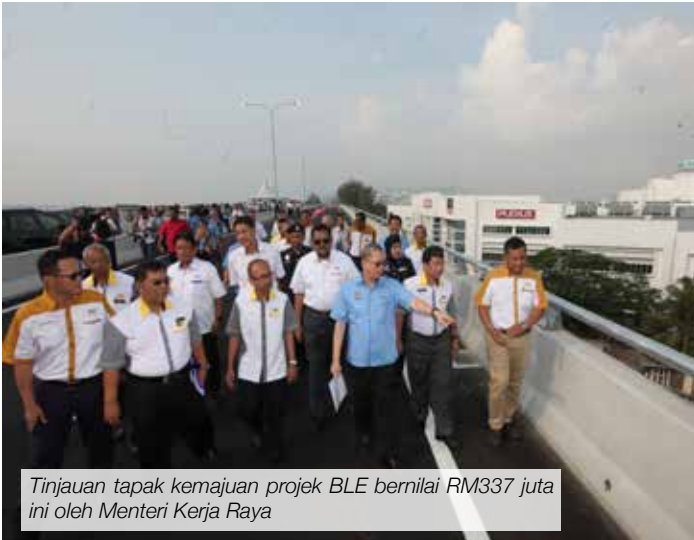
Tinjauan tapak kemajuan projek BLE bernilai RM337 juta ini oleh Menteri Kerja Raya