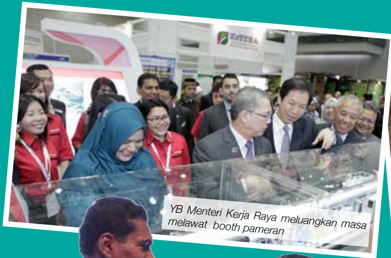
YB Menteri Kerja Raya meluangkan masa melawat booth pameran

ICW2016 menghimpunkan 100 ruang pameran dan menjangkakan kehadiran 10,000 pengunjung dengan 10% daripadanya pengunjung luar negara. Antara program utama termasuklah Ecobuild Southeast Asia 2016 dan Construction Career Fair 2016. Beberapa pertandingan turut dirangka antaranya, My City 2050, Rebuild It Green, IEM Mechanical Design Competition dan lain-lain lagi.