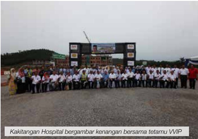
Kakitangan Hospital bergambar kenangan bersama tetamu VVIP