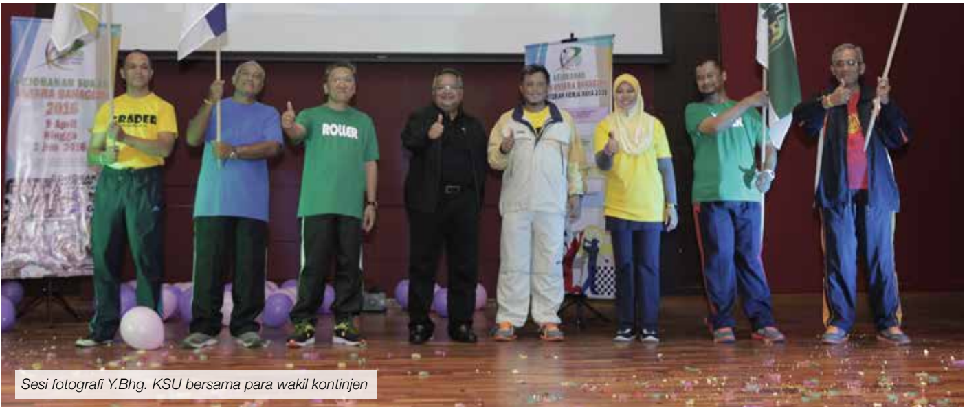
Sesi fotografi Y.Bhg. KSU bersama para wakil kontinjen