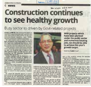
Surat Khabar : STAR Tarikh : 12 April 2016

Abg Medu Terbaik @RoslanMdTaha @JKRMalaysia @MOWorks @jkr_kedah