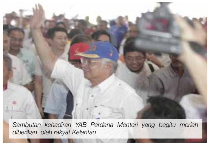
Sambutan kehadiran YAB Perdana Menteri yang begitu meriah diberikan oleh rakyat Kelantan