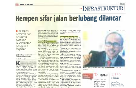
Surat Khabar : BERITA HARIAN Tarikh : 10 MEI 2016