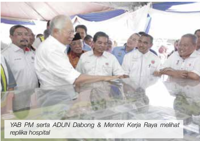
YAB PM serta ADUN Dabong & Menteri Kerja Raya melihat replika hospital