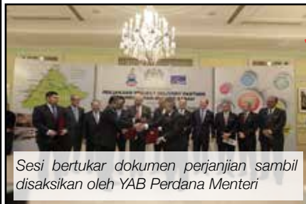
Sesi bertukar dokumen perjanjian sambil disaksikan oleh YAB Perdana Menteri