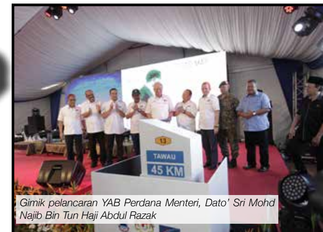
Gimik pelancaran YAB Perdana Menteri, Dato' Sri Mohd Najib Bin Tun Haji Abdul Razak