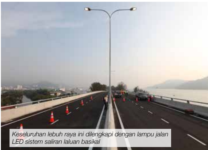
Keseluruhan lebuh raya ini dilengkapi dengan lampu jalan LED sistem saliran laluan basikal