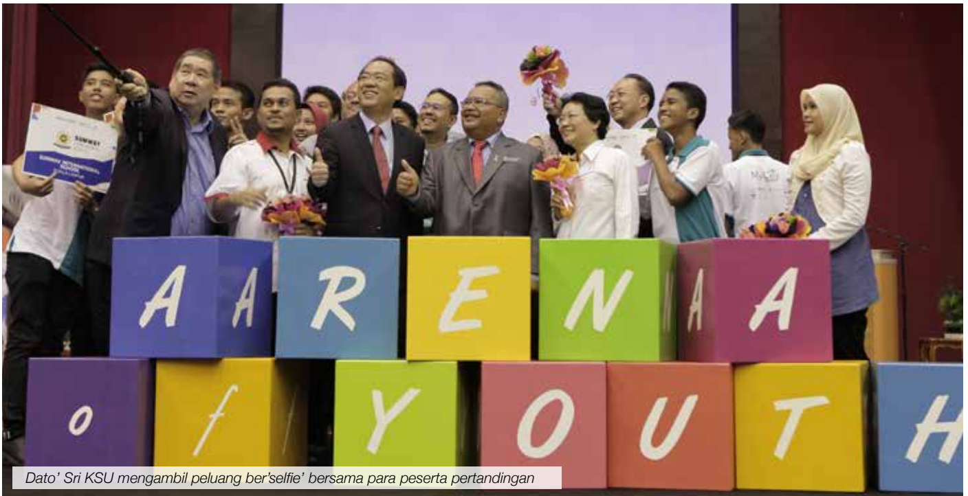
Dato' Sri KSU mengambil peluang ber'selfie' bersama para peserta pertandingan