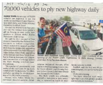
Surat Khabar : NEW STRAITS TIMES Tarikh : 07 April 2016