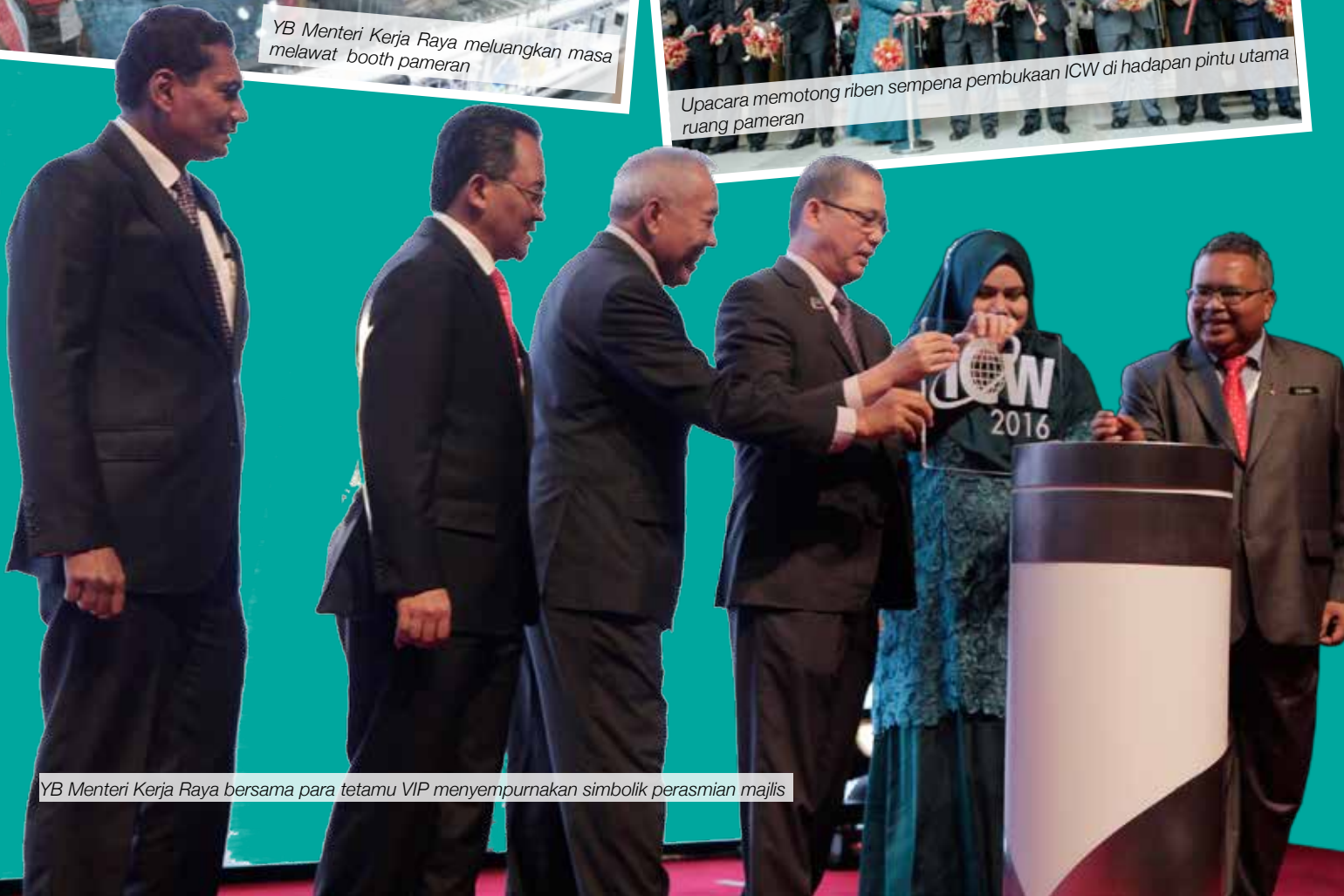
YB Menteri Kerja Raya bersama para tetamu VIP menyempurnakan simbolik perasmian majlis