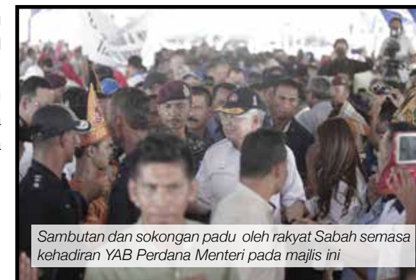
Sambutan dan sokongan padu oleh rakyat Sabah semasa kehadiran YAB Perdana Menteri pada majlis ini