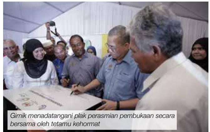
Gimik menandatangani plak perasmian pembukaan secara bersama oleh tetamu kehormat