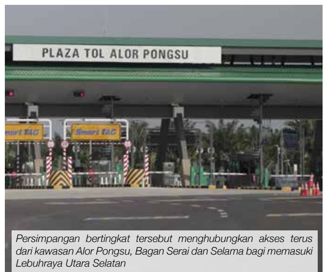
Persimpangan bertingkat tersebut menghubungkan akses terus dari kawasan Alor Pongsu, Bagan Serai dan Selama bagi memasuki Lebuhraya Utara Selatan