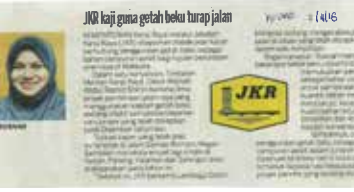
Surat Khabar : KOSMO Tarikh : 02 April 2016