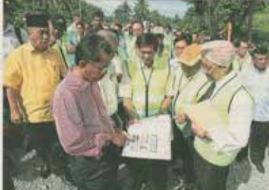
More than 1,000 villagers in the Kuala Selat area are expected to benefit from the completion of a road project in the area.

SEKUALA KEBANGSAI: More than 1,000 villagers in the Kuala Selat area are expected to benefit from the completion of a road project in the area.