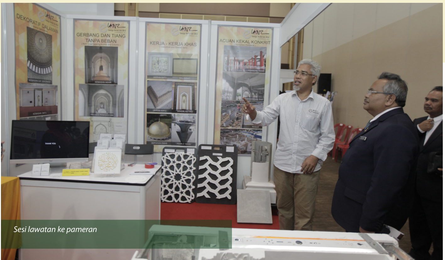
Sesi lawatan ke pameran

Bumiputera (Gred G1 – G7) dan 50 usahawan bahan binaan Bumiputera dari seluruh negara.