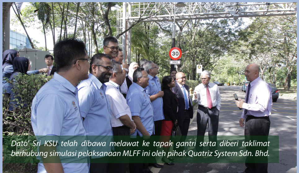
Dato' Sri KSU telah dibawa melawat ke tapak gantri serta diberi taklimat berhubung simulasi pelaksanaan MLFF ini oleh pihak Quatriz System Sdn. Bhd.

Sepanjang program tersebut, Dato' Sri KSU telah dibawa melawat ke tapak gantri serta diberi taklimat berhubung simulasi pelaksanaan MLFF ini oleh pihak Quatriz System Sdn. Bhd. Konsep MLFF merupakan hasil pelaburan penyelidikan dan pembangunan (R&D) Kementerian Sains, Teknologi dan Inovasi (MOSTI) yang berjumlah RM19.59 juta dan