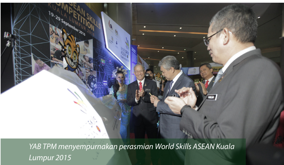
YAB TPM menyempurnakan perasmian World Skills ASEAN Kuala Lumpur 2015

MATEPM 2015 merupakan anugerah tertinggi bidang kemahiran negara untuk dua kategori pertandingan kemahiran iaitu Worldskills Malaysia Belia (WSMB) dan Worldskills Malaysia Pengajar (WSMP).