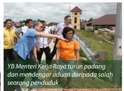
YB Menteri Kerja Raya turun padang dan mendengar aduan daripada salah seorang penduduk

semasa musim banjir dan memberi keselesaan dan keselamatan kepada pengguna. Selain itu ia bakal menjadi pemangkin kemajuan ekonomi bagi Johor Utara terutama di Daerah Muar, Ledang dan Segamat.