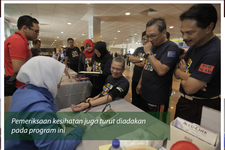
Pemeriksaan kesihatan juga turut diadakan pada program ini