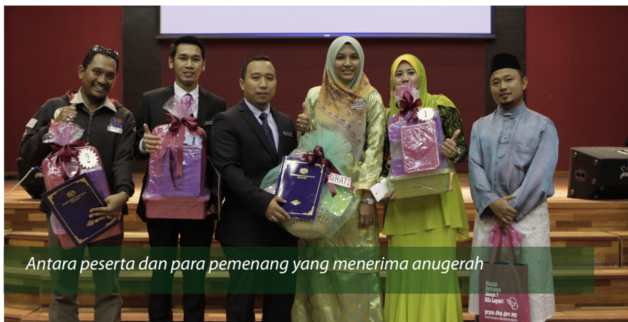
Antara peserta dan para pemenang yang menerima anugerah

Tahun 2015 merupakan tahun kedua KKR terlibat dalam pelaksanaan Bahasa Kebangsaan. KKR diletakkan di bawah Sektor Kerja Raya, Jawatankuasa Kecil