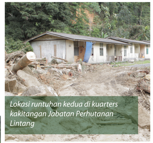
Lokasi runtuhan kedua di kuarters kakitangan Jabatan Perhutanan Lintang

KL-Karak dan menasihati orang ramai supaya menggunakan jalan alternatif. Berdasarkan kajian yang telah dibuat oleh pakar cerun dari Jabatan Kerja Raya (JKR) Malaysia, banjir lumpur biasanya berlaku di kawasan tadahan yang agak besar dan pencetusnya ialah hujan lebat yang telah mencairkan tanah kemudian mengalir turun ke lebuhraya.