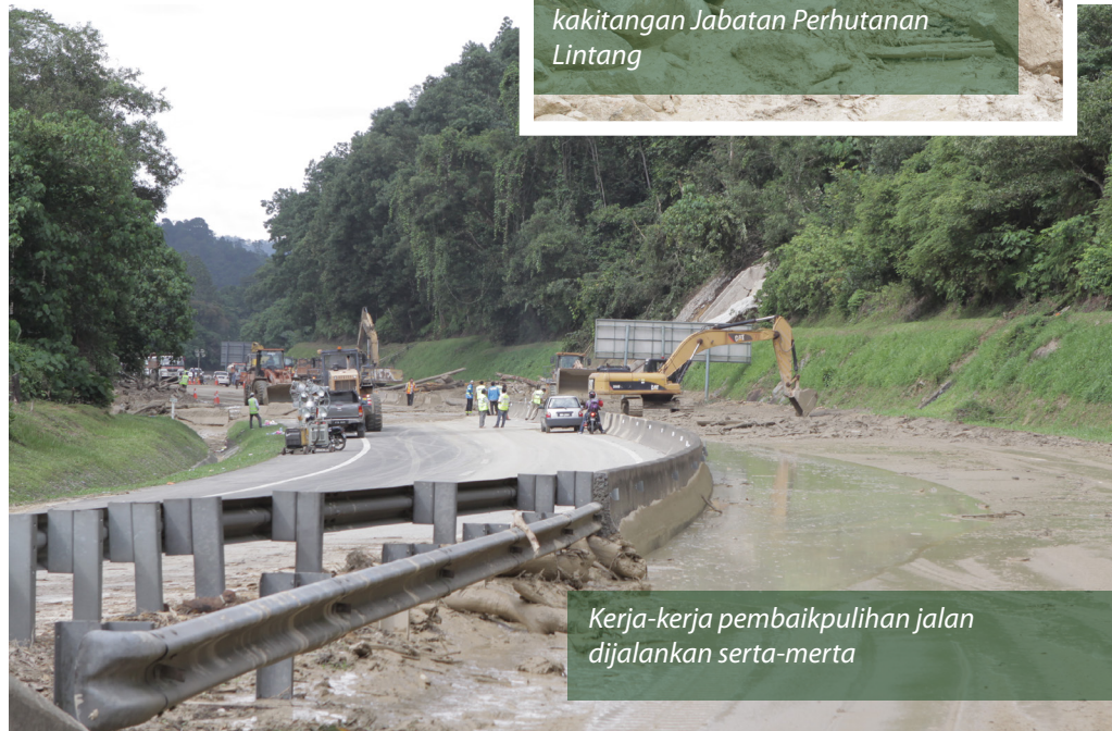
Kerja-kerja pembaikpulihan jalan dijalankan serta-merta