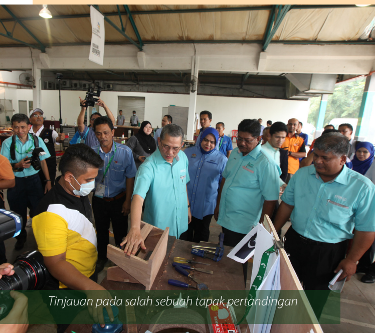
Tinjauan pada salah sebuah tapak pertandingan

Pertandingan ini menarik seramai 1000 orang penggiat industri pembinaan seperti pembekal bahan guna habis, peserta pertandingan, para jurulatih, pakar-pakar bidang dan institusi latihan kemahiran bertujuan untuk berkongsi idea dan memperkenalkan teknologi baru dalam pembinaan bagi peningkatan kecekapan produktiviti industri pembinaan melibatkan bidang yang dipertandingkan.