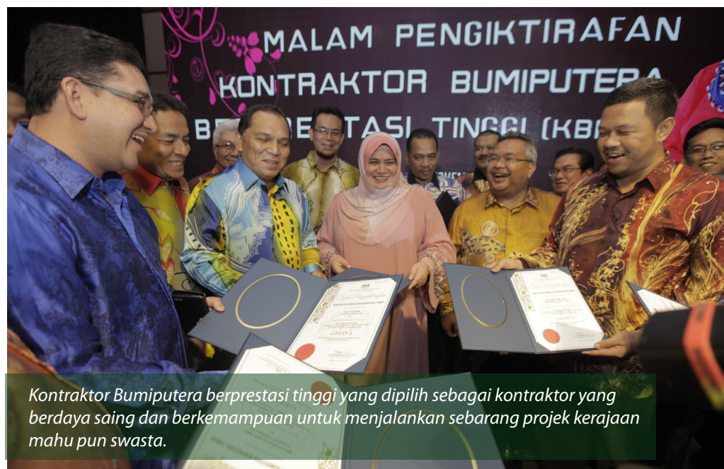
Kontraktor Bumiputera berprestasi tinggi yang dipilih sebagai kontraktor yang berdaya saing dan berkemampuan untuk menjalankan sebarang projek kerajaan mahu pun swasta.

Simposium yang diadakan pada 3 dan 4 November 2015 dan bertempat di Pusat Konvensyen Shah Alam (SACC) ini menyasarkan seramai 1,000 kontraktor Bumiputera (Gred G1 – G7) dan 50 usahawan bahan binaan Bumiputera dari seluruh negara.