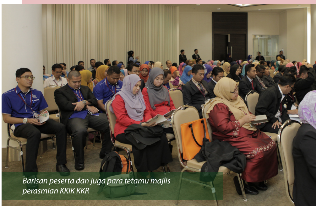
Barisan peserta dan juga para tetamu majlis perasmian KKIK KKR

Konvensyen KIK KKR dilaksanakan sebagai salah satu program di bawah Minggu Inovasi KKR 2015 dan para pemenang akan diraikan pada Hari Inovasi KKR yang turut dirangka sebagai pengisian minggu inovasi ini.