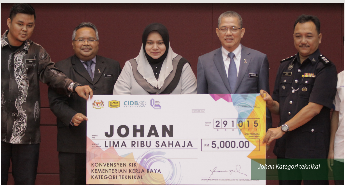
Johan Kategori teknikal

Hari Inovasi Kementerian Kerja Raya telah diadakan sejak tahun 2010 bagi menggantikan Hari Kualiti yang telah diperkenalkan oleh kerajaan pada tahun 1987. Hari Inovasi diadakan pada setiap tahun selaras dengan usaha kerajaan untuk melaksanakan pembaharuan dan penambahbaikan sistem penyampaian perkhidmatan awam yang berasaskan inovasi dan kreativiti.