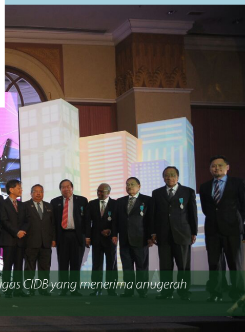
Turut diraikan ialah lapan petugas CIDB yang menerima anugerah khidmat 20 tahun