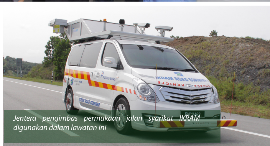
Jentera pengimbas permukaan jalan syarikat IKRAM digunakan dalam lawatan ini

PERASING, 28 Oktober 2015 – Bagi menilai keadaan permukaan Lebuhraya Pantai Timur Fasa 2 (LPT2) secara lebih dekat, YB Dato' Sri Haji Fadillah Haji Yusof, Menteri Kerja Raya telah mengadakan lawatan kerja untuk menilai sendiri jajaran LPT2 bermula hentian rehat dan rawat Perasing hingga ke persimpangan Chukai, Terengganu menggunakan jentera pengimbas permukaan jalan syarikat IKRAM.