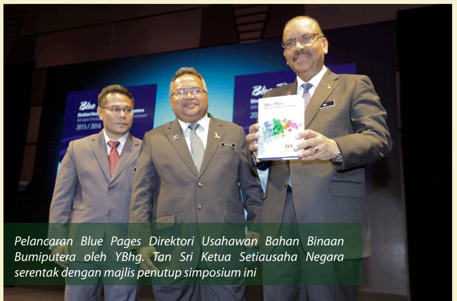
Pelancaran Blue Pages Direktori Usahawan Bahan Binaan Bumiputera oleh YBhg. Tan Sri Ketua Setiausaha Negara serentak dengan majlis penutup simposium ini

dengan majlis penutup simposium ini. 'Blue Pages' ini bertujuan untuk mempromosikan produk keluaran usahawan binaan Bumiputera dan bertindak sebagai pemangkin kepada usahawan Bumiputera untuk mengembangkan perniagaan di dalam industri binaan.