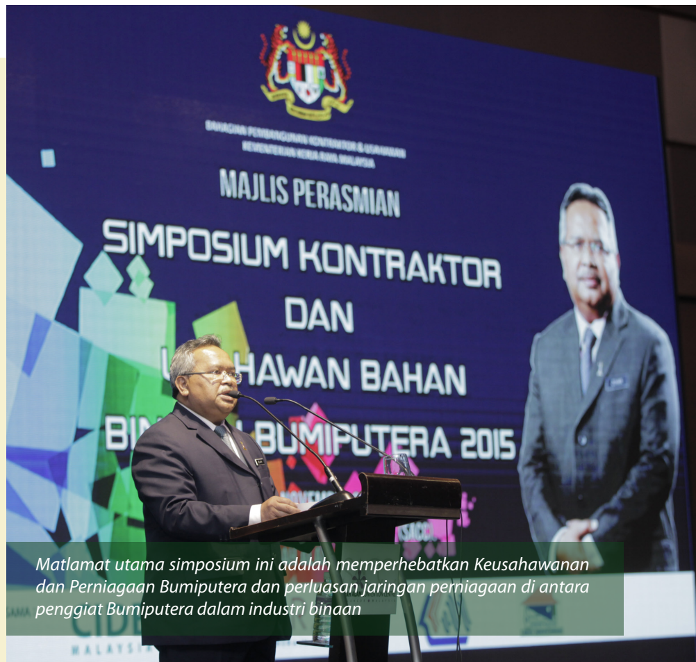
Matlamat utama simposium ini adalah memperhebatkan Keusahawanan dan Perniagaan Bumiputera dan perluasan jaringan perniagaan di antara penggiat Bumiputera dalam industri binaan

'Blue Pages' ini mengandungi maklumat 473 usahawan bahan binaan Bumiputera yang berdaftar dengan Kementerian Kerja Raya melalui BPKU. Antara maklumat yang dinyatakan di dalam 'Blue Pages' adalah seperti nama syarikat, alamat, nama Pengarah Urusan, alamat emel, nombor telefon dan senarai produk. 'Blue Pages' ini disasarkan kepada penggiat industri binaan seperti kontraktor, pemaju dan perunding, agensi Kerajaan, 'Government Link Companies' (GLC), Syarikat – syarikat Konsesi Lebuhraya dan Bangunan Persekutuan dan Badan – Badan Profesional Industri Binaan. Terdahulu, bersempena dengan simposium ini, telah diadakan Malam Pengiktirafan Kontraktor Bumiputera Berprestasi Tinggi (KBBT) pada 3 November 2015 yang diadakan bagi memberikan pengiktirafan kepada 22 orang kontraktor gred G7 Bumiputera berprestasi tinggi yang dipilih sebagai kontraktor yang berdaya saing dan berkemampuan untuk menjalankan sebarang projek kerajaan mahu pun swasta.