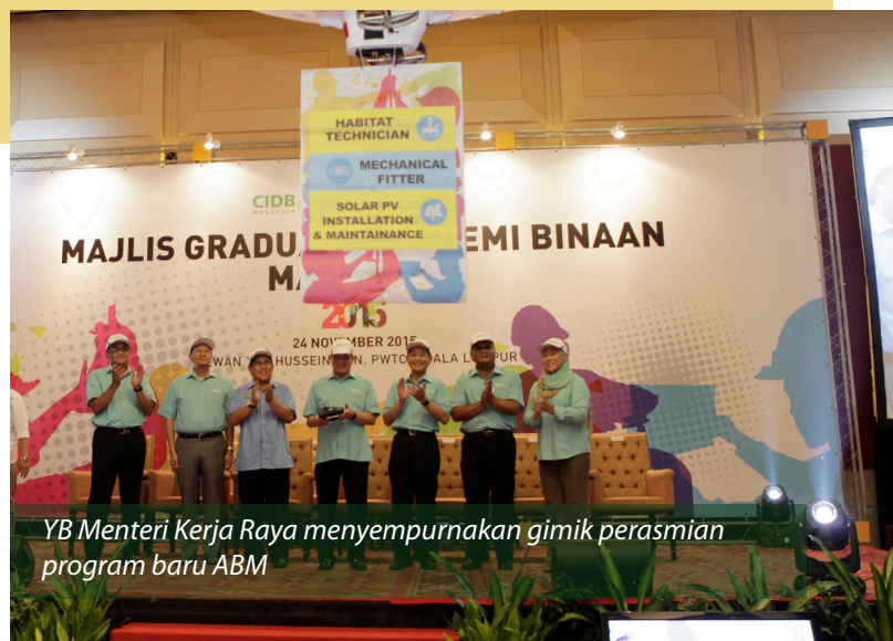
YB Menteri Kerja Raya menyempurnakan gimik perasmian program baru ABM