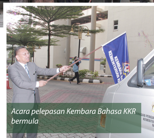
Acara pelepasan Kembara Bahasa KKR bermula