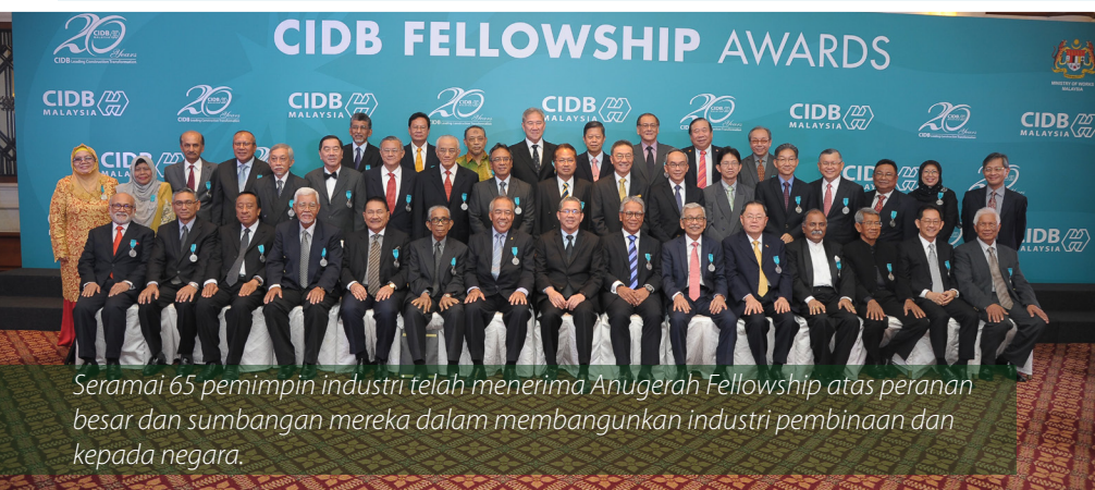
Seramai 65 pemimpin industri telah menerima Anugerah Fellowship atas peranan besar dan sumbangan mereka dalam membangunkan industri pembinaan dan kepada negara.

Secara umumnya, industri pembinaan Malaysia dijangka menyumbang kira-kira 5.5 peratus atau RM36.3 bilion kepada ekonomi negara serta berpotensi memberi peluang pekerjaan dianggarkan sebanyak 9.5 peratus daripada tenaga kerja negara.