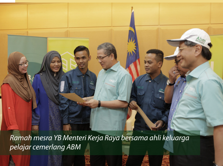
Ramah mesra YB Menteri Kerja Raya bersama ahli keluarga pelajar cemerlang ABM

Akademi Binaan Malaysia yang ditubuhkan pada tahun 1997 memainkan peranan penting di dalam mengeluarkan pekerja mahir tempatan untuk berkhidmat dalam sektor pembinaan negara. Sejak daripada awal penubuhannya sehingga kini, jumlah pelatih yang telah dilahirkan oleh ABM mencapai 270,011 orang daripada Program Belia dan Personel.