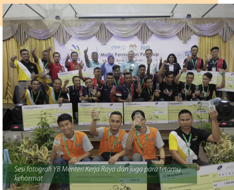
Sesi fotografi YB Menteri Kerja Raya dan juga para tetamu kehormat