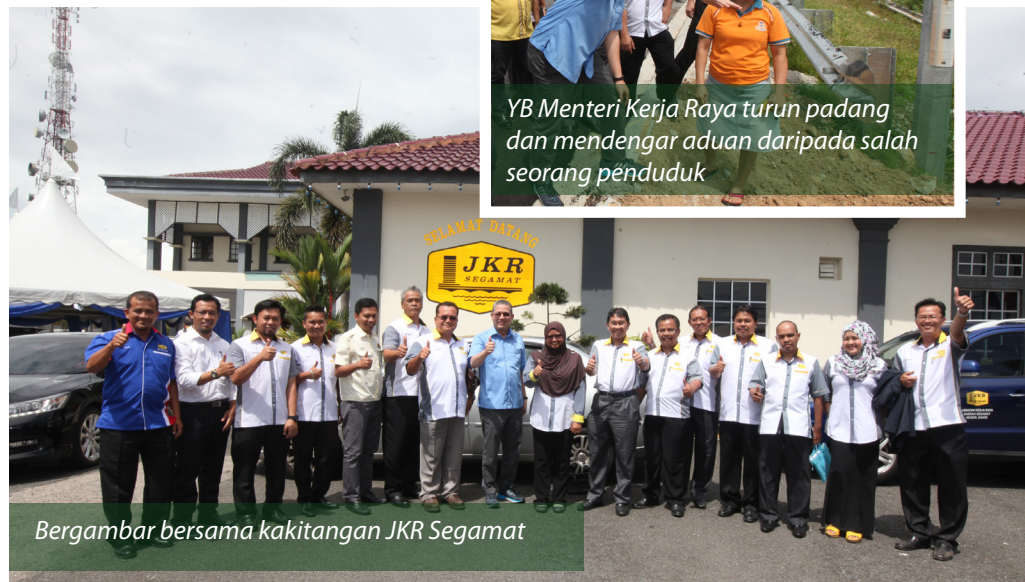
Bergambar bersama kakitangan JKR Segamat