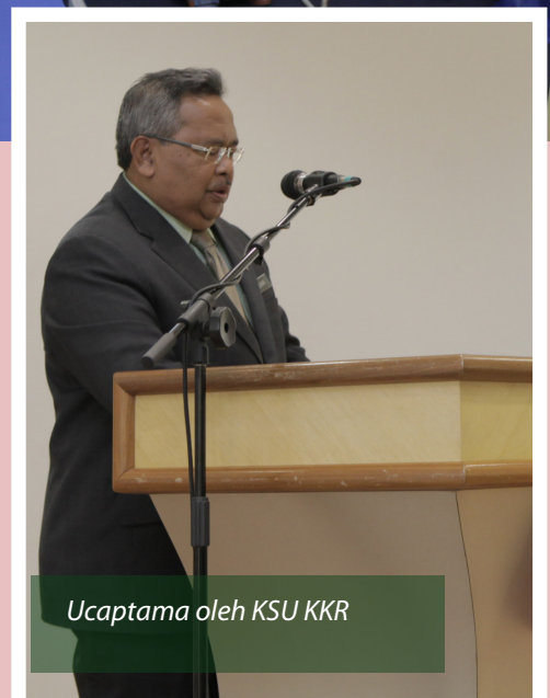
Ucuptama oleh KSU KKR

Konvensyen Kumpulan Inovatif dan Kreatif Kementerian Kerja Raya (KKR) mula dilaksanakan pada tahun 2010 selaras dengan Panduan Kumpulan Inovatif dan Kreatif (KIK) yang telah dikeluarkan oleh MAMPU pada 1 November 2009. Konvensyen ini adalah merupakan penambahbaikan dan penjenamaan semula terhadap Pertandingan Kumpulan Meningkatkan Mutu Kerja (KMK) yang telah