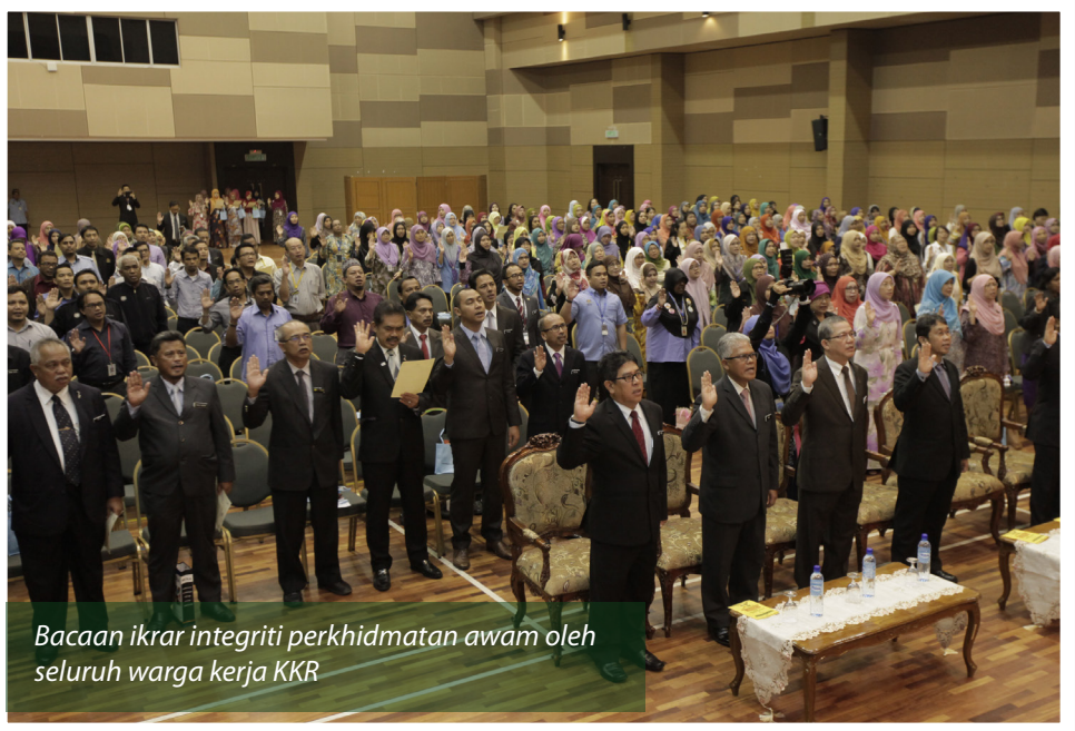
Bacaan ikrar integriti perkhidmatan awam oleh seluruh warga kerja KKR

Justeru itu, buat julung kalinya Unit Integriti Kementerian Kerja Raya telah menganjurkan Hari Integriti Kementerian Kerja Raya bertemakan "Amanah Tonggak Integriti" dan Wacana Ilmu berbentuk forum dengan tajuk yang sama. Hari Integriti ini dianjurkan dengan tujuan memupuk kesedaran di kalangan anggota di Kementerian