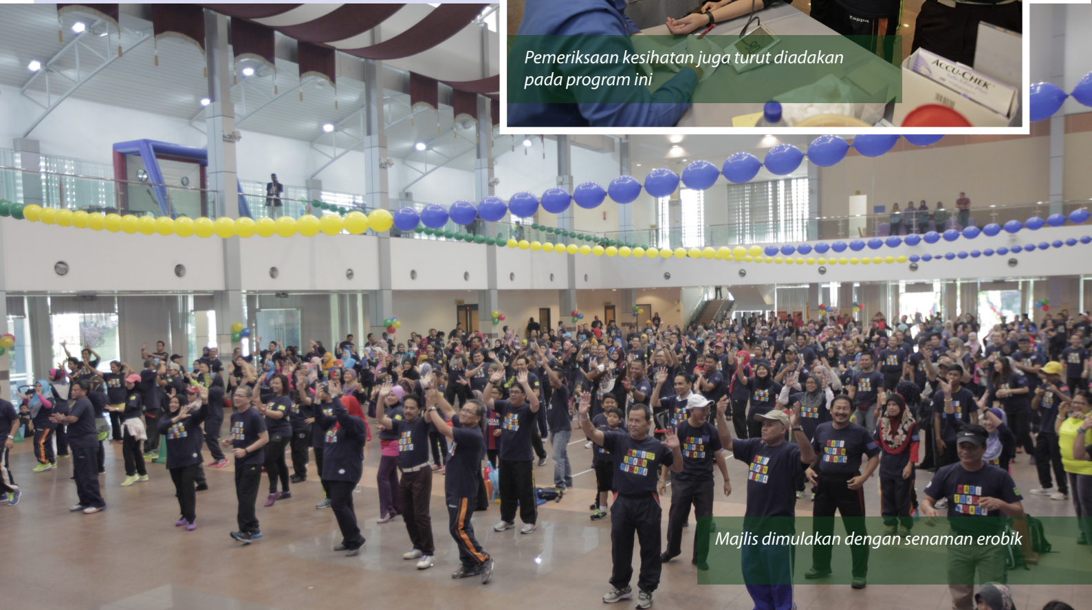
Majlis dimulakan dengan senaman erobik