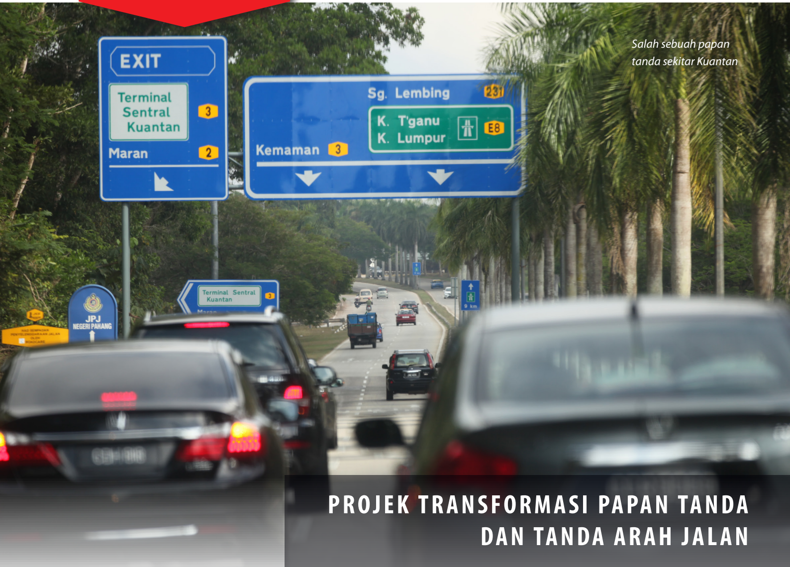
Salah sebuah papan tanda sekitar Kuantan