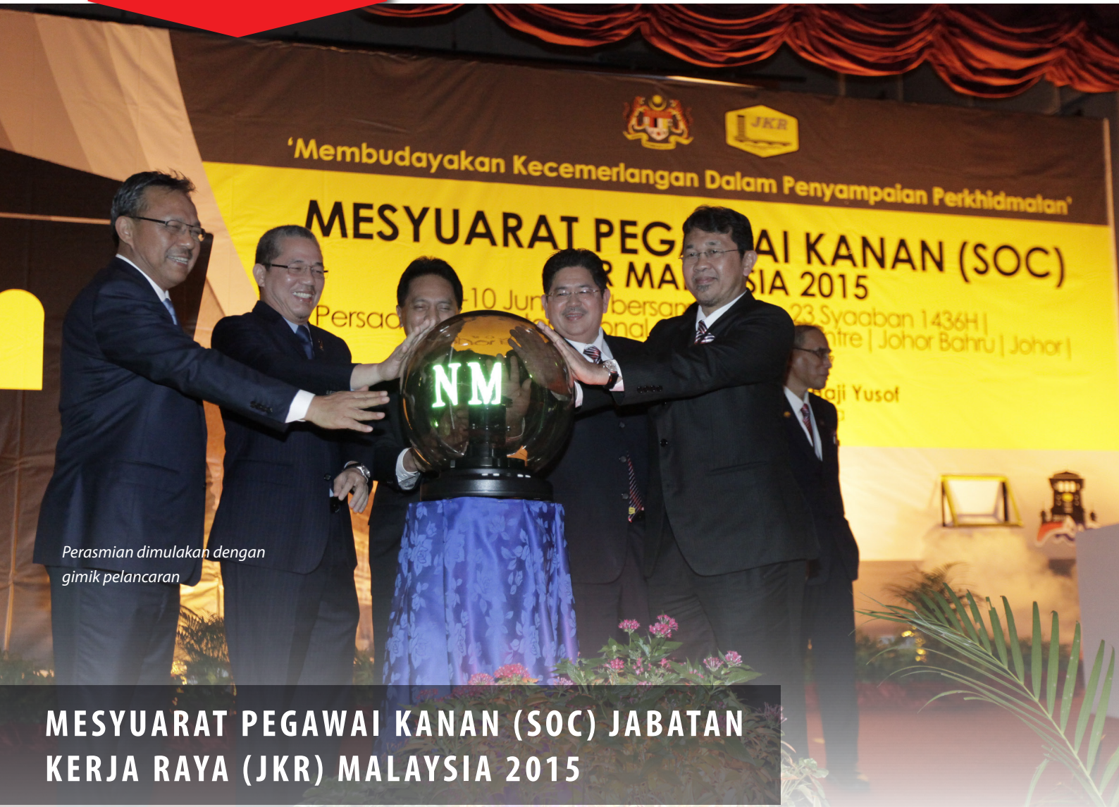
Perasmian dimulakan dengan gimik pelancaran