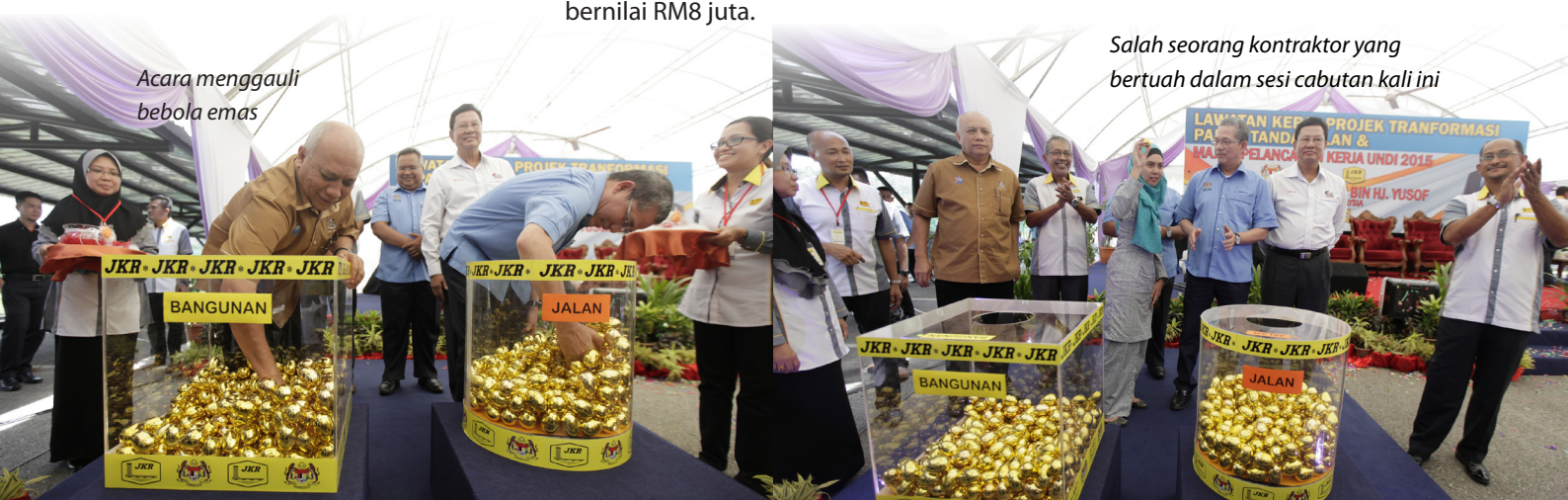
Salah seorang kontraktor yang bertuah dalam sesi cabutan kali ini