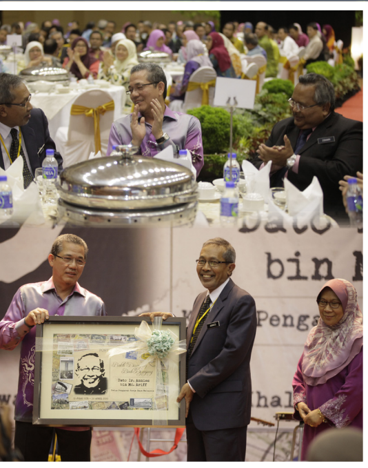
YBM mewakili KKR menyampaikan Cenderahati kenang kenangan dari warga kerja KKR

Penghormatan dari YBM dan KSU kerja raya untuk ucapan persaraan beliau