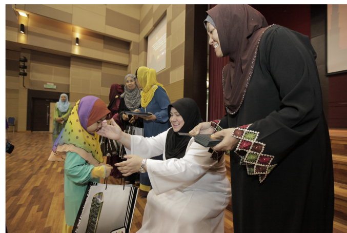
Pemberian sumbangan oleh YB Timbalan Menteri Kerja Raya