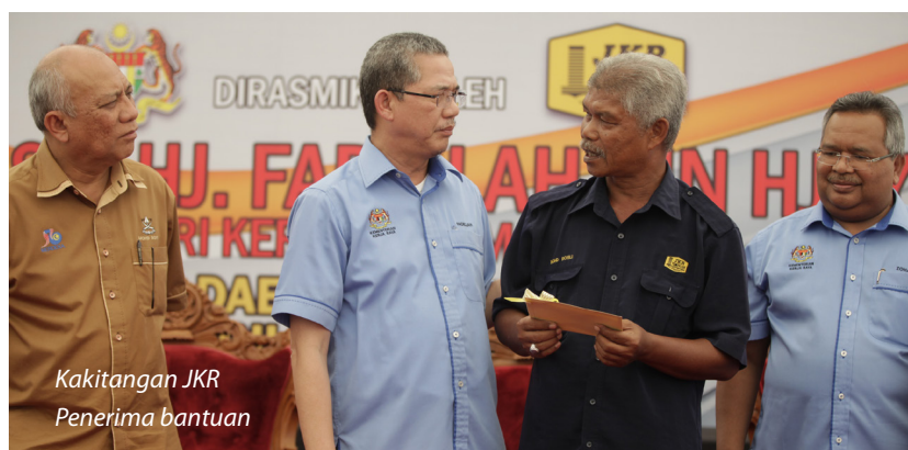
Kakitangan JKR Penerima bantuan