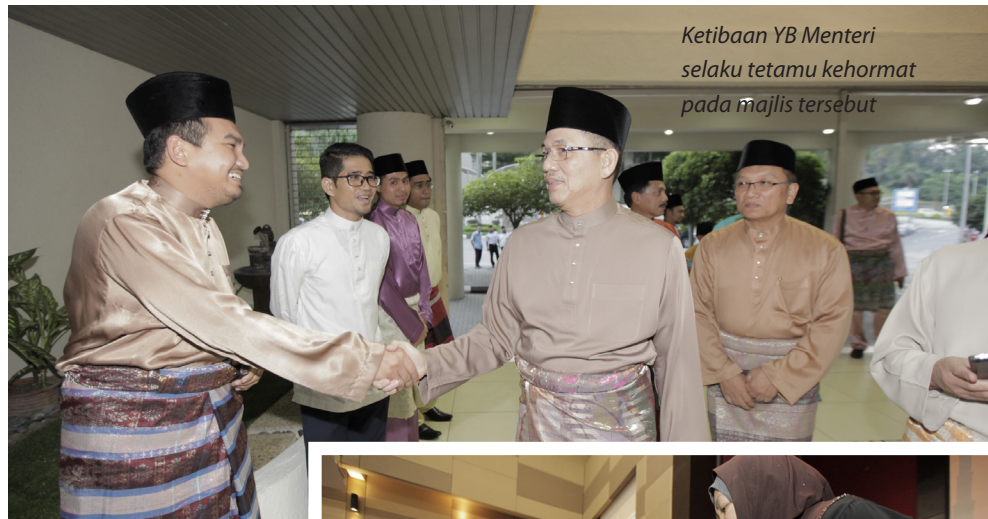
Ketibaan YB Menteri selaku tetamu kehormat pada majlis tersebut