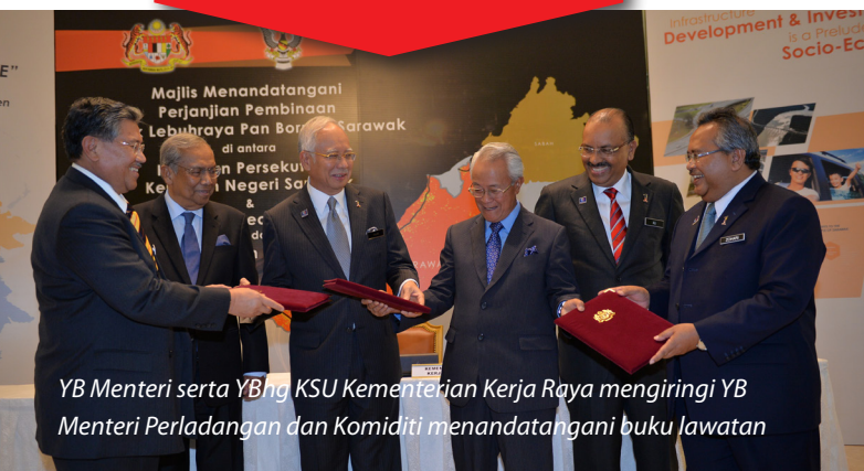
YB Menteri serta YBhg KSU Kementerian Kerja Raya mengiringi YB Menteri Perladangan dan Komiditi menandatangani buku lawatan