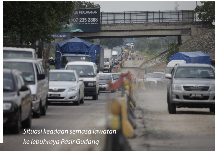
Situasi keadaan semasa lawatan ke lebuhraya Pasir Gudang