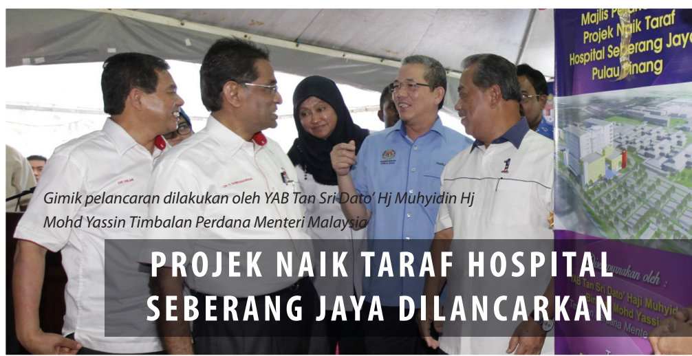
Gimik pelancaran dilakukan oleh YAB Tan Sri Dato' Hj Muhyidin Hj Mohd Yassin Timbalan Perdana Menteri Malaysia

Keluasan tapak projek yang dirancang adalah 3.26 ekar dan terletak di dalam kawasan hospital. Antara impak kerja naik taraf ini ialah Blok Multi-storey ini bakal menyediakan kemudahan rawatan perubatan dan ruangan kerja yang lebih lengkap bagi menampung bilangan