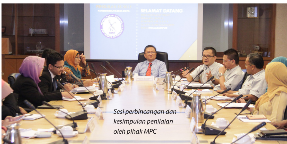
Sesi perbincangan dan kesimpulan penilaian oleh pihak MPC

Amalan Persekitaran Berkualiti 5S diamalkan di Kementerian ini bertujuan mewujudkan persekitaran kerja sistematik dan berkualiti seterusnya dapat memenuhi kehendak pelanggan Kementerian berasaskan kepada lima kaedah iaitu, Sisi, Susun, Sapu, Seragam dan Sentiasa Amal.