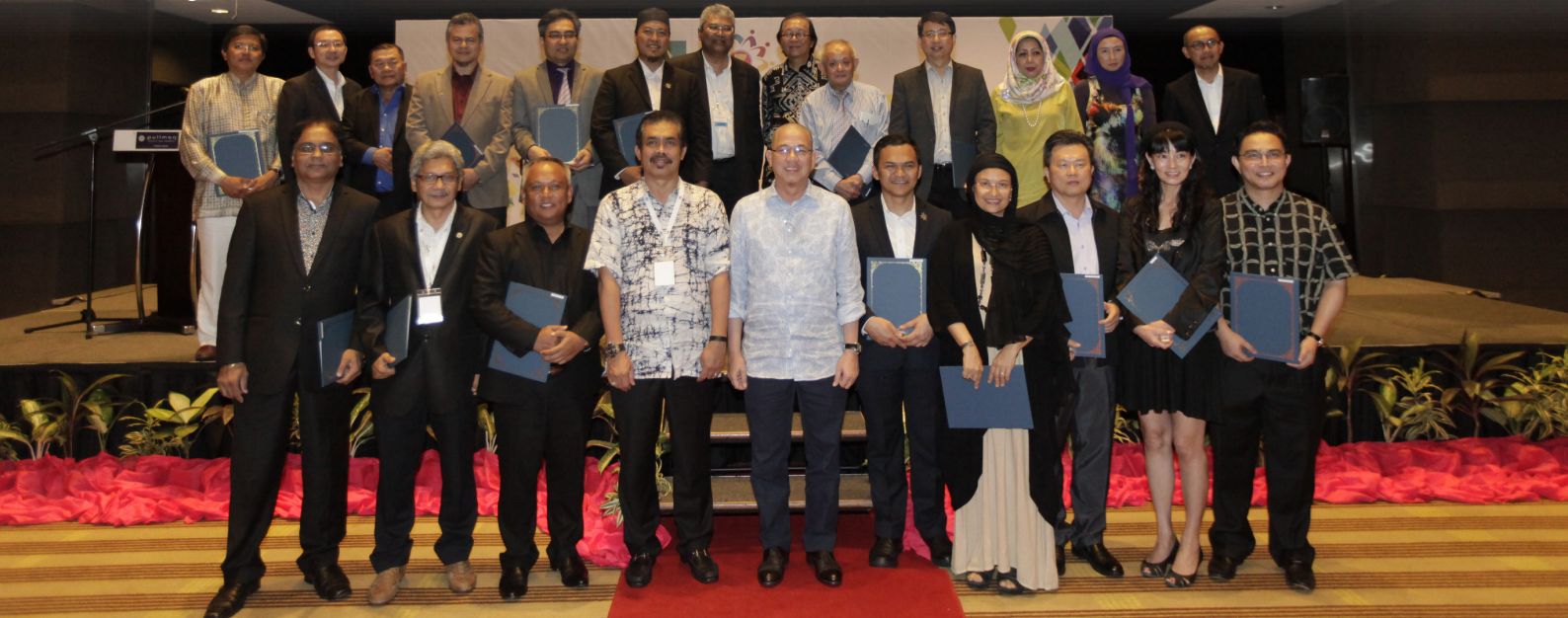
Penerima anugerah sijil dari Lembaga Arkitek