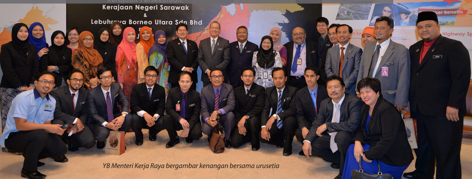
YB Menteri Kerja Raya bergambar kenangan bersama urusetia

PUTRAJAYA, 30 Jun 2015 – Satu Majlis Menandatangani Perjanjian Pembinaan Projek Lebuhraya Pan Borneo Sarawak telah diadakan di antara Kerajaan Persekutuan, Kerajaan Negeri Sarawak dan Lebuhraya Borneo Utara Sdn. Bhd di Jabatan Perdana Menteri hari ini.