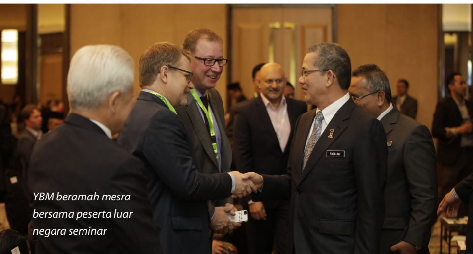
YBM beramah mesra bersama peserta luar negara seminar

Ucuptama perasmian telah disampaikan oleh YB Dato’ Sri Haji Fadillah bin Haji Yusof, Menteri Kerja Raya, yang turut merasmikan ruang pameran yang menghimpun syarikat berkaitan teknologi ukur, pembekal bahan binaan dan perunding hartanah.