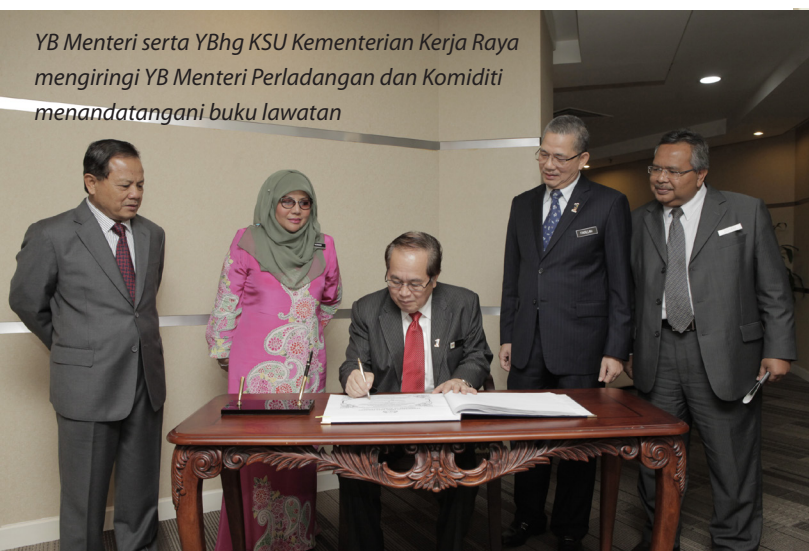
YB Menteri serta YBhg KSU Kementerian Kerja Raya mengiringi YB Menteri Perladangan dan Komiditi menandatangani buku lawatan

Upacara perjanjian ini telah disaksikan oleh YB Dato' Sri Fadillah Yusof, Menteri Kerja Raya dan YB Datuk Amar Douglas Unggah Embas, Menteri Perusahaan Perladangan dan Komoditi.