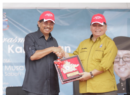
Pemberian Cenderahati kepada tetamu kehormat perasmian majlis

tahun 2004, Kerajaan Negeri telah memohon untuk pembinaan projek ini dan UPE,JPM telah luluskan skop projek iaitu pembinaan jalan gravel sepanjang 145 km dengan kos projek sebanyak RM636 juta. Projek pembinaan jalan gravel ini bermula pada tahun 2004 dan siap sepenuhnya pada tahun 2008.