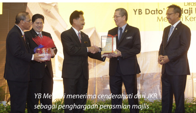
YB Menteri menerima cenderahati dari JKR sebagai penghargaan perasmian majlis

Mesyuarat selama tiga hari ini telah diadakan di Pusat Konvensyen Antarabangsa Persada Johor dan Jawatankuasa Induk penganjuran kali ini diurusetikan oleh JKR Johor.