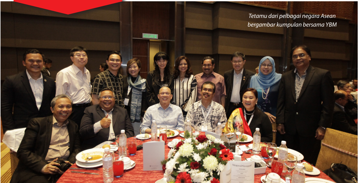
Tetamu dari pelbagai negara Asean bergambar kumpulan bersama YBM

PUTRAJAYA, 5 Mei – Selaras dengan The ASEAN Coordinating Committee on Services Meeting yang berlangsung pada 4 hingga 8 Mei 2015 di Kuala Lumpur, satu majlis Makan Malam ASEAN telah dianjurkan oleh Lembaga Arkitek Malaysia (LAM) bertempat di Hotel Pullman, Putrajaya.