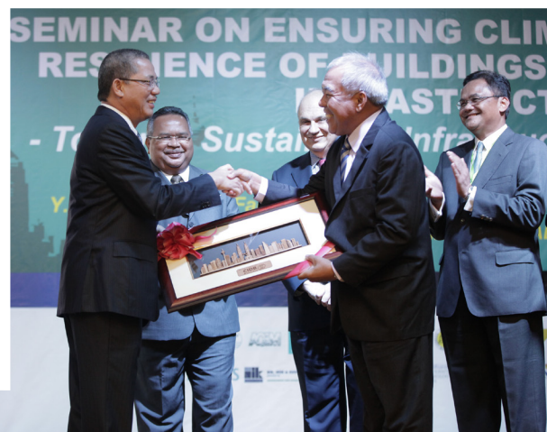
Pemberian cenderahati daripada pihak penganjur sebagai tanda penghargaan