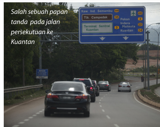
Salah sebuah papan tanda pada jalan persekutuan ke Kuantan

Arahan Teknik Jalan JKR dengan "UK Traffic Signs Manual". Ia berjaya disiapkan dalam tempoh yang singkat iaitu 6 bulan. Kos merekabentuk dan memasang papan tanda bagi projek ini adalah lebih murah kerana rekabentuk papan tanda mengoptimumkan penggunaan ruang dan seterusnya menghasilkan papan tanda yang bersaiz lebih kecil.