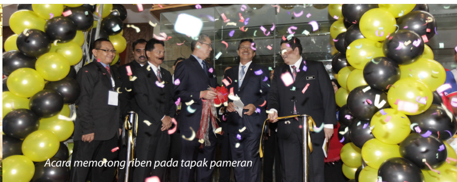
Acara memotong riben pada tapak pameran