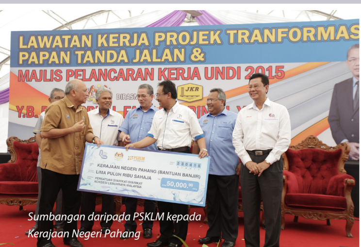
Sumbangan daripada PSKLM kepada Kerajaan Negeri Pahang

Selain daripada kutipan yang dibuat oleh Kementerian, satu lagi agensi dalam Kementerian iaitu Lembaga Lebuhraya Malaysia (LLM) telah mengambil inisiatif yang sama. LLM bersama Persatuan Syarikat-Syarikat Konsesi Lebuhraya Malaysia (PSKLM) juga telah mengadakan kutipan berbentuk wang tunai, makanan dan pakaian. Sebanyak RM300 ribu telah berjaya dikutip dan pada hari ini sebanyak RM50 ribu disalurkan kepada mangsa banjir di negeri Pahang.