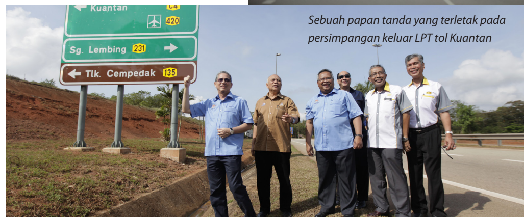
Sebuah papan tanda yang terletak pada persimpangan keluar LPT tol Kuantan