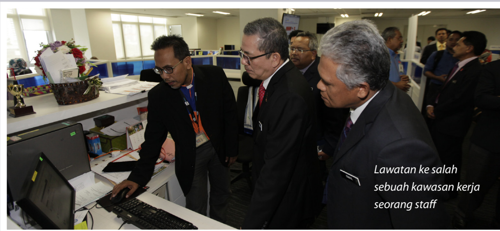
Lawatan ke salah sebuah kawasan kerja seorang staff

kementerian kepada pihak Utusan Malaysia yang telah banyak membantu memberi hebahan dan publisiti kepada semua aktiviti serta program kementerian selama ini.