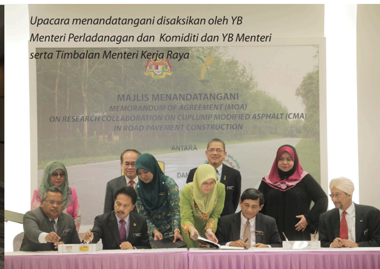
Upacara menandatangani disaksikan oleh YB Menteri Perladangan dan Komiditi dan YB Menteri serta Timbalan Menteri Kerja Raya