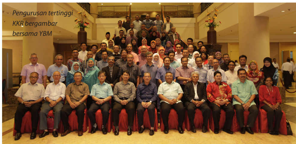
Pengurusan tertinggi KKR bergambar bersama YBM