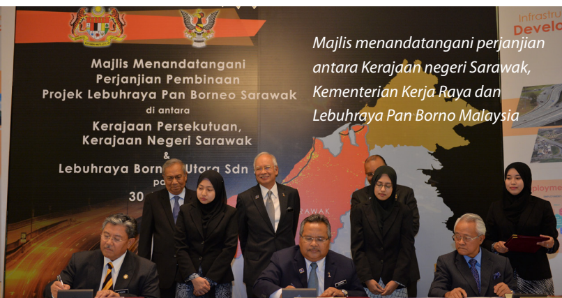
Majlis menandatangani perjanjian antara Kerajaan negeri Sarawak, Kementerian Kerja Raya dan Lebuhraya Pan Borneo Malaysia