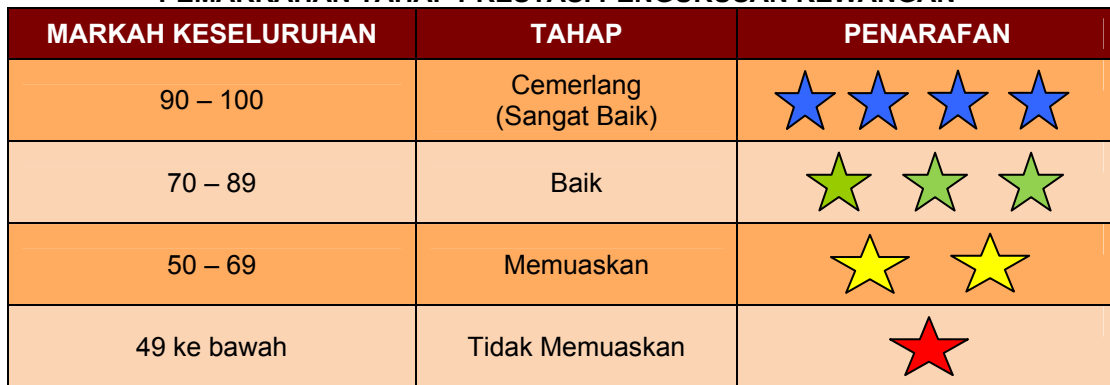
JADUAL 5.1 PEMARKAHAN TAHAP PRESTASI PENGURUSAN KEWANGAN